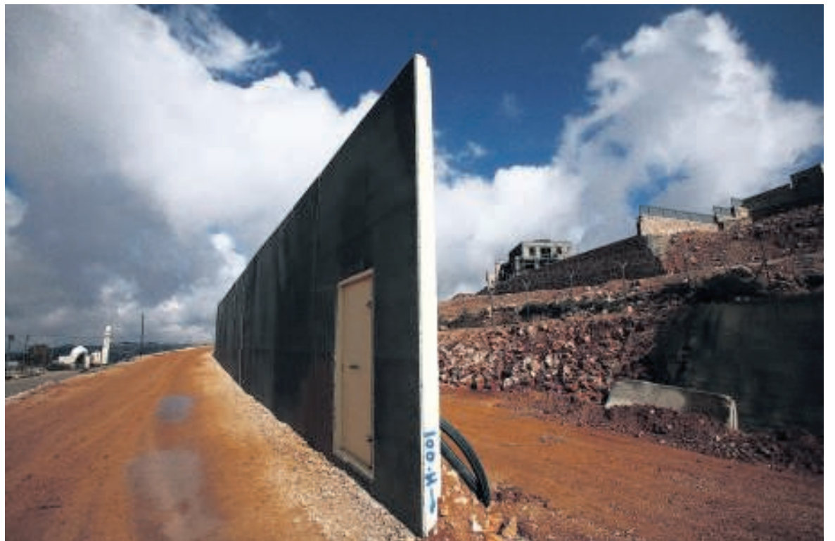
De muur die de Joodse nederzetting Har Gilo scheidt van een Palestijns dorp op de Westelijke Jordaanoever

onderhandelen. Er is een derde beweging die nu populairder wordt, de Volkscomités, die zich in eerste